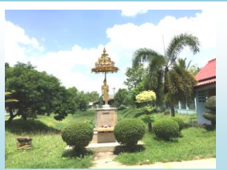
พุทธสถาน